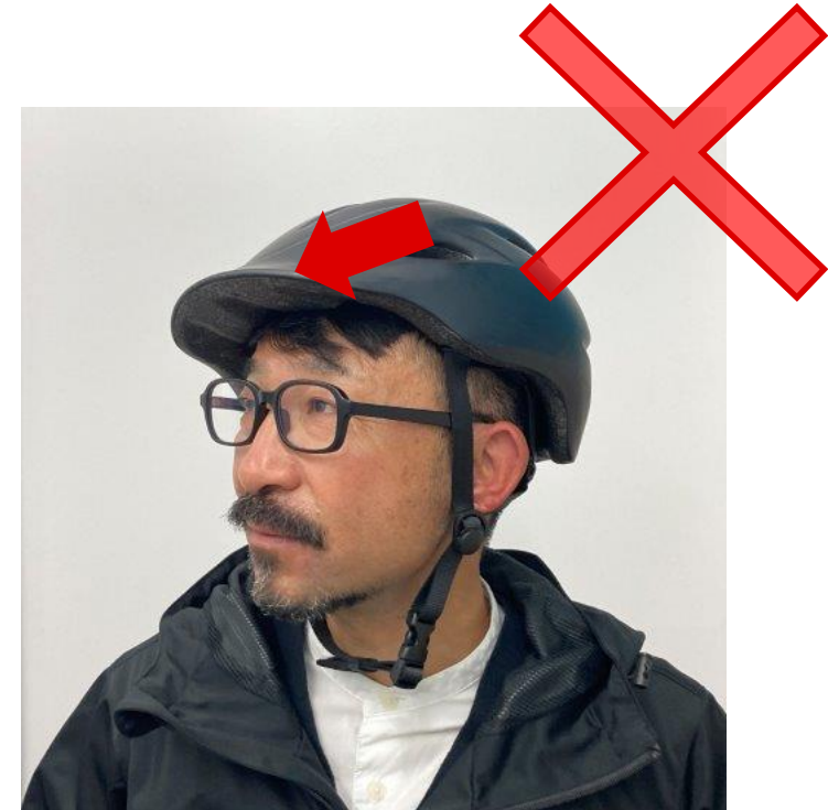
斜めにかぶっている